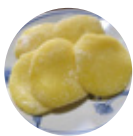
老舗餅店「あわびや」 バター餅