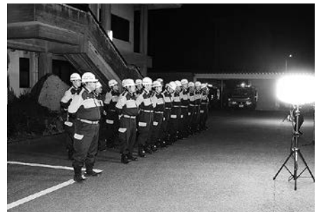
年末夜警激励式の様子