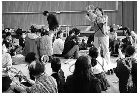
講師の説明を聞いて

講師から、しめ縄の由来や言い伝えなどの説明を受けた後、子どもたちは、講師や学級生に教えてもらいながら、何とかしめ縄を完成させることができました。