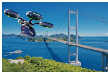
▲来島海峡大橋と空飛ぶクルマ