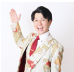
▲地理芸人「トフィー」 (松竹芸能所属)