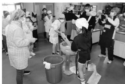
べったんべったん！

餅つきの後は、民話紙芝居や大型カルタ取り大会で盛り上がりました。児童からは「餅つきやあんこ包みが楽しかった」「今まで知らなかった玉川のことが詳しくわかった」という声が聞こえてきました。