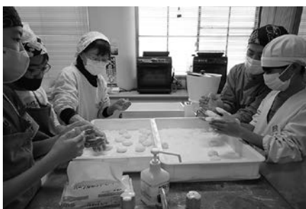
きれいに丸められるかな