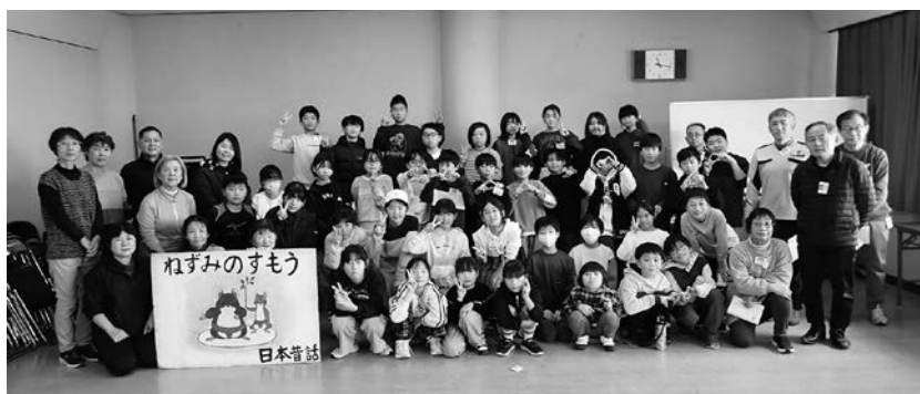
みんな楽しかったね