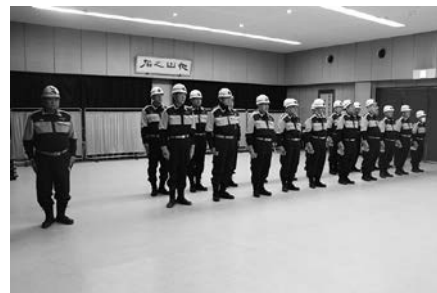
年末夜警激励式の様子