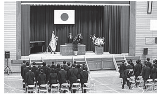
しまなみ高等学校

今年は、小学校に5人、中学校に20人、しまなみ高校に40人(大三島キャンパス20人、伯方キャンパス20人)が入学し、それぞれの新しい学校生活が始まりました。