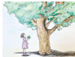
A4判ハードカバー (20ページ) 予約販売のみ