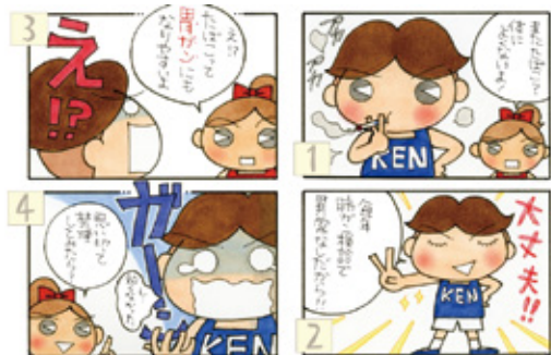
たばこは百害あって一利なし