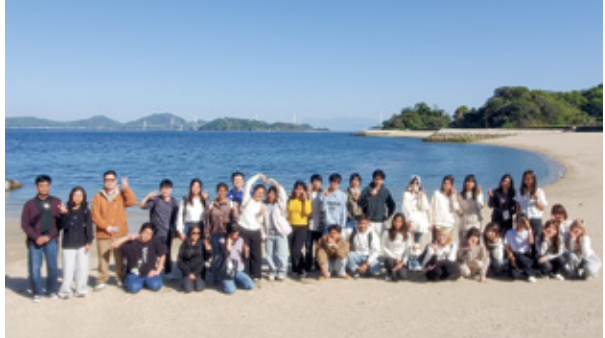
大角海浜公園にて

今年度は、ミャンマー・ネパール・中国・インドネシア・スリランカの留学生たちが、日本人学生と一緒に学んでいます。地域へ外向く授業も多く、多文化共生社会を意識した活動が、めいたんの特徴の一つになっています。