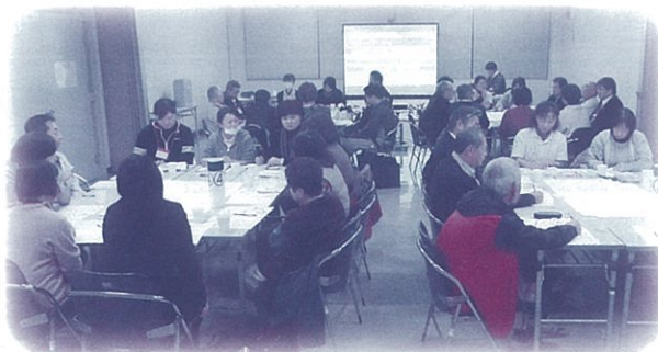
広域地域ケア会議(朝倉地区)の様子