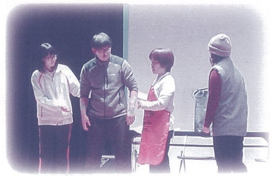
地域包括支援センター 社会福祉士部会による寸劇

虐待をしている養護者は「虐待をしている」という自覚がない場合が多く、高齢者自身も「他人に知られたくない」など、虐待は周囲から見えにくいものです。地域で気になる高齢者がいる場合は、お近くの地域包括支援センターへご相談ください。