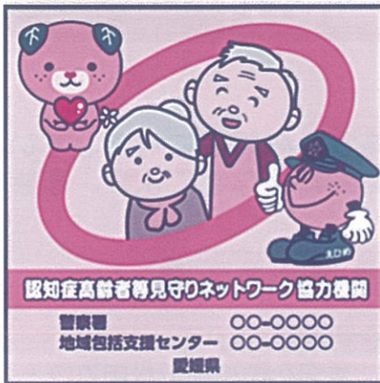
↑協力機関のステッカー

今治市では、市内の事業協力機関や地域包括支援センター等と連携して、認知症高齢者の方やご家族を支える「認知症高齢者等見守りネットワーク事業(通称“いまからネット”)」に取り組んでいます。