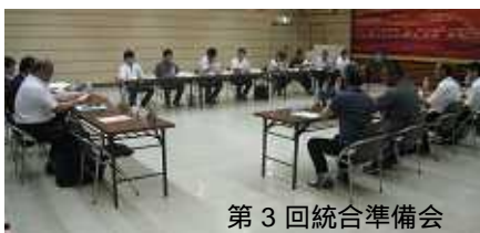
第 3 回統合準備会

その後、6 月開催の今治市議会において、『平成 27 年 4 月に統合し、新校名を今治市立大三島中学校とする』ことが議決されました。