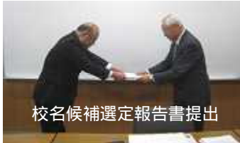
校名候補選定報告書提出

平成 25 年 6 月 26 日（水）上浦開発総合センターにおいて、上浦中学校・大三島中学校統合準備会（第 3 回）が開催されました。主な協議内容をお知らせします。