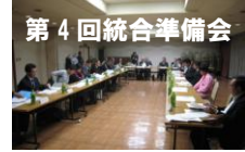
第 4 回統合準備会

平成 25 年 11 月 7 日（木）大三島公民館において、上浦中学校・大三島中学校 統合準備会（第 4 回）が開催されました。主な協議内容をお知らせします。