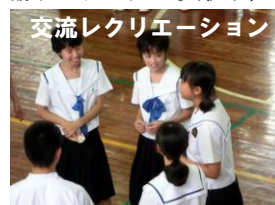
交流レクリエーション