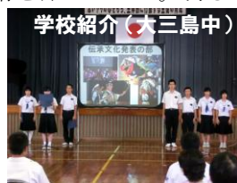
学校紹介（大三島中）