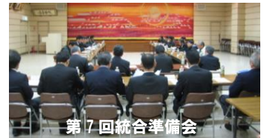
第 7 回統合準備会

平成 27 年 2 月 18 日（水）上浦開発総合センターにおいて、上浦中学校・大三島中学校統合準備会（第 7 回）が開催されました。主な協議内容をお知らせします。