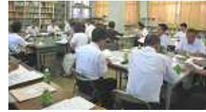
第 4 回統合準備会

平成 25 年 7 月 16 日（火）今治小学校図書室において、今治市内中心部 4 小学校統合準備会（第 4 回）が開催されました。主な協議内容をお知らせします。