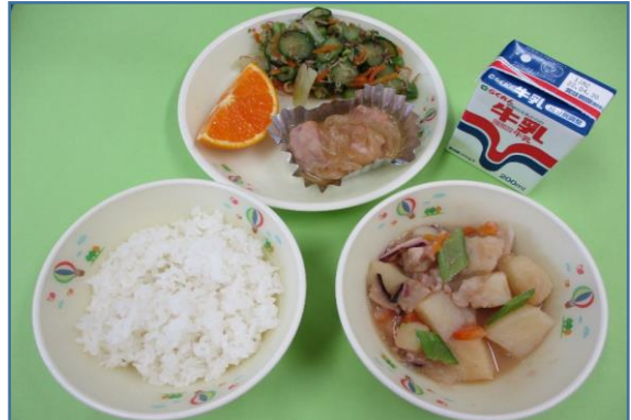
令和4年4月の献立 ごはん たこじゃが 鶏肉のはちみつ焼き アスパラのちりめんあえ キヨミ