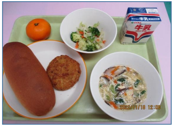
令和4年11月の献立 コッパン 卵スープ さつまいもコロケ ブロッコリーのごま酢あえ みかん