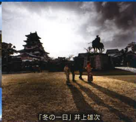
「冬の一日」井上雄次