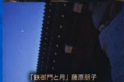
「鉄御門と月」藤原朋子