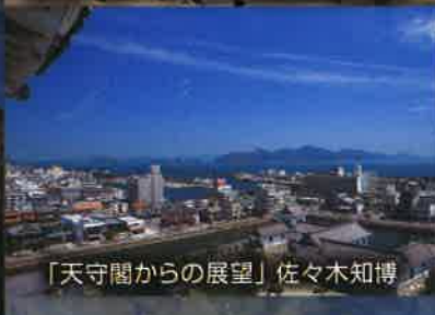
「天守閣からの展望」佐々木知博