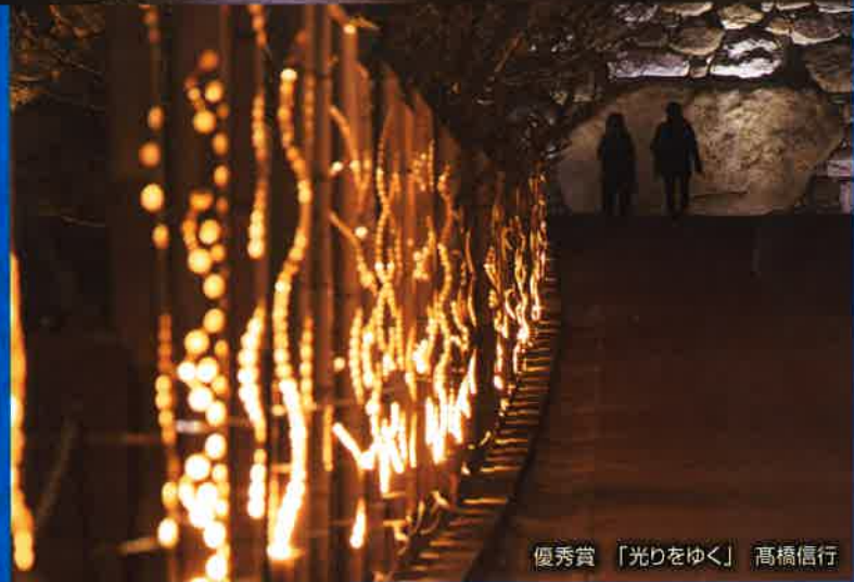
優秀賞 「光りをゆく」 高橋信行