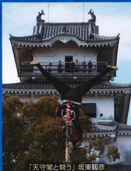
「天守閣と鶴う」坂東鞆彦