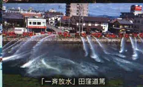
「一斉放水」田窪道篤

昨年度に開催した第2回今治城写真コンテストの入賞作品全20点を一堂に展示。今治城の素敵な、そしてユニークな一瞬を捉えた力作が揃いました。お気に入りの1枚を見つけてください。