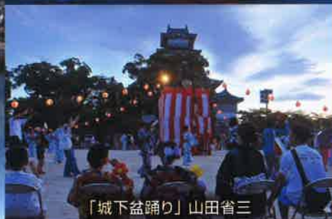
「城下盆踊り」山田省三