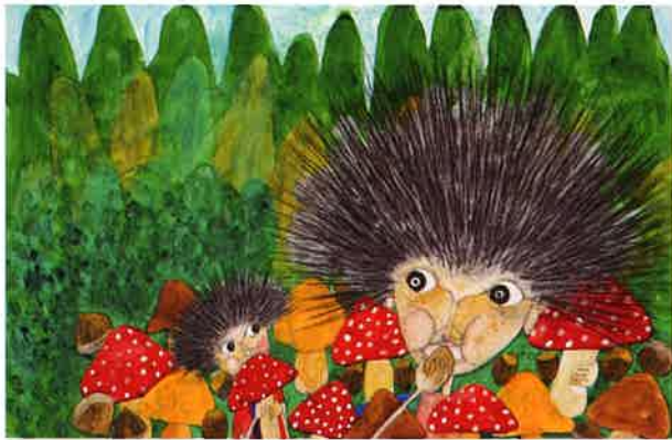
『ばあちゃんがいる』伊藤比呂美 文/MAYA MAXX 絵 (福音館書店 2019年)より 今治市河野美術館 〒794-0042 今治市旭町 1-4-8