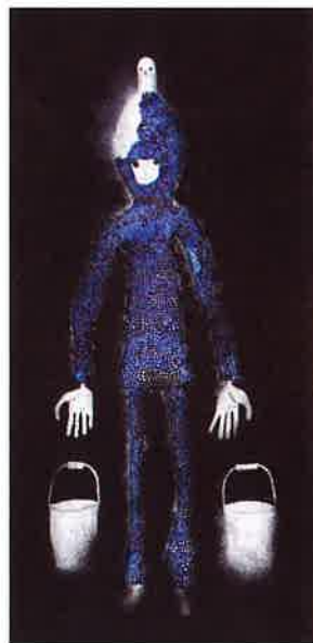
『Be kind and have the courage.Heaven 2020』