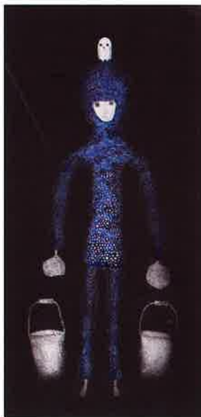
『Be kind and have the courage.Earth 2020』