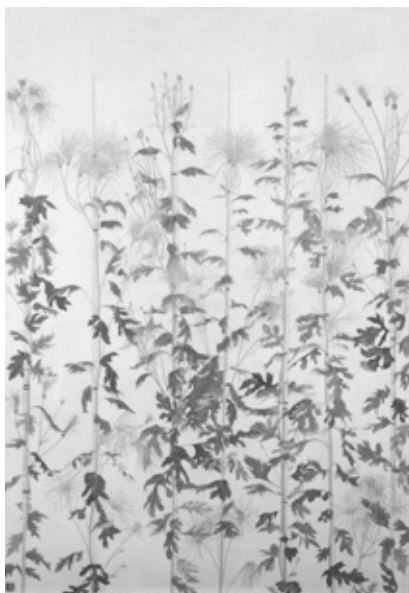
5 嵯峨菊 太田利花