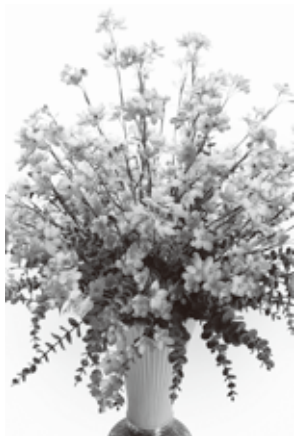
3 さくらひめ 越智みさお

大三島美術館が所蔵する現代日本画と、大三島をベースに活動する布花作家・越智みさお氏の作品の、「四季」という共通テーマでのコラボ展示。異ジャンルコラボの四季の彩が楽しめます。今回の越智みさお氏の作品はSDGsの環境保護の一環として、思い出の大切な着物が大幅の花として生まれ変わっています。