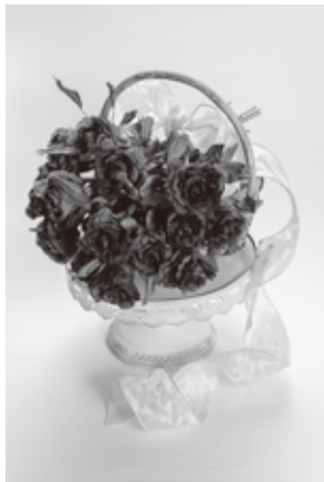
4 枯れていく赤いバラ 越智みさお