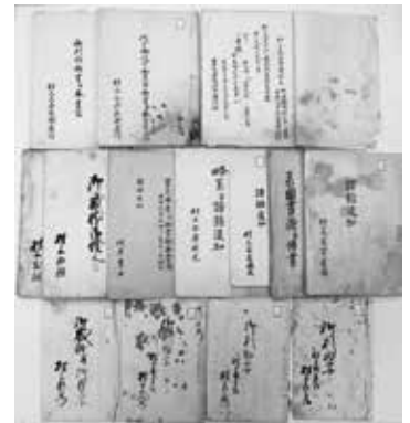
萩藩に提出した「譜録」等の写(個人蔵・村上海賊ミュージアム保管)