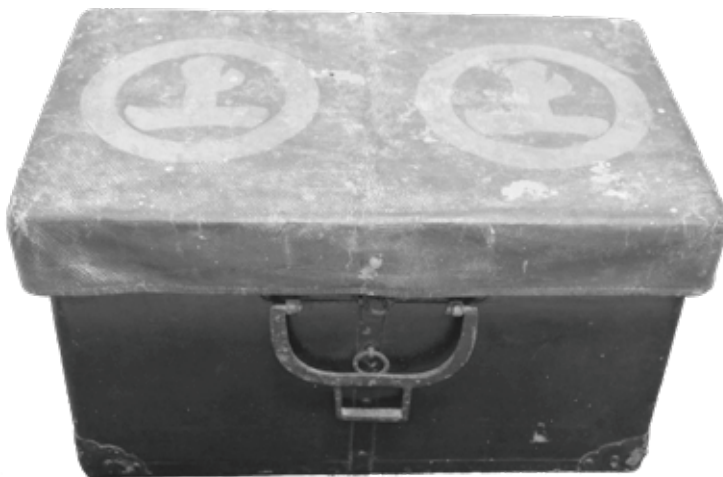
能島村上家伝来文箱(個人蔵・村上海賊ミュージアム保管)