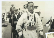
昭和42年頃の古写真

阿波のふかふか 一丁 田代崎のむね板下 二丁 子川のむね板下 三丁 子川のむね板下 四丁 子川のむね板下 五丁 子川のむね板下 六丁 子川のむね板下 七丁 子川のむね板下 八丁 子川のむね板下 九丁 子川のむね板下 十丁 子川のむね板下 十一丁 子川のむね板下 十二丁 子川のむね板下 十三丁 子川のむね板下 十四丁 子川のむね板下 十五丁 子川のむね板下 十六丁 子川のむね板下 十七丁 子川のむね板下 十八丁 子川のむね板下 十九丁 子川のむね板下 二十丁 子川のむね板下