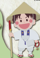
Oshima Shimashikoku Henro