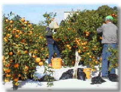
(地域農業振興) (第19条)