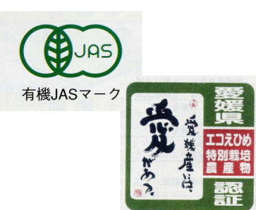
(有機農業) (第2章第4節)