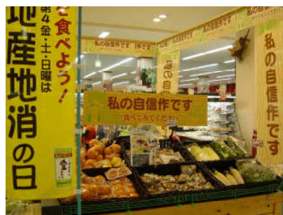
(地産地消) (第2章第3節)