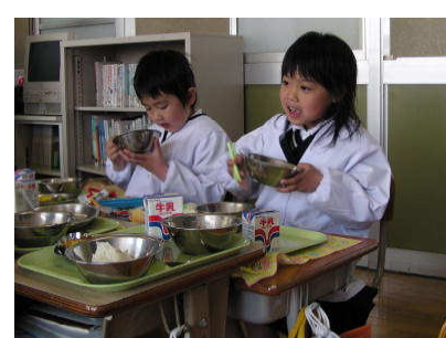
(食育・学校給食) (第11条)