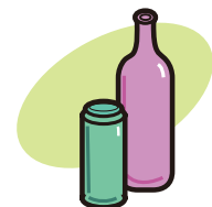
その他の色のびん