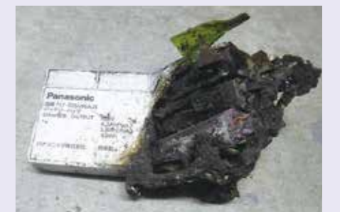
発火したリチウムイオン電池