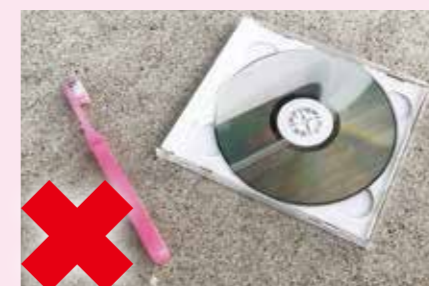
歯ブラシ、CD(ケース含む)