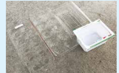
卵、豆腐などのパック