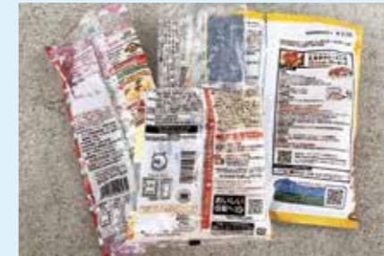
お菓子、食品などの袋