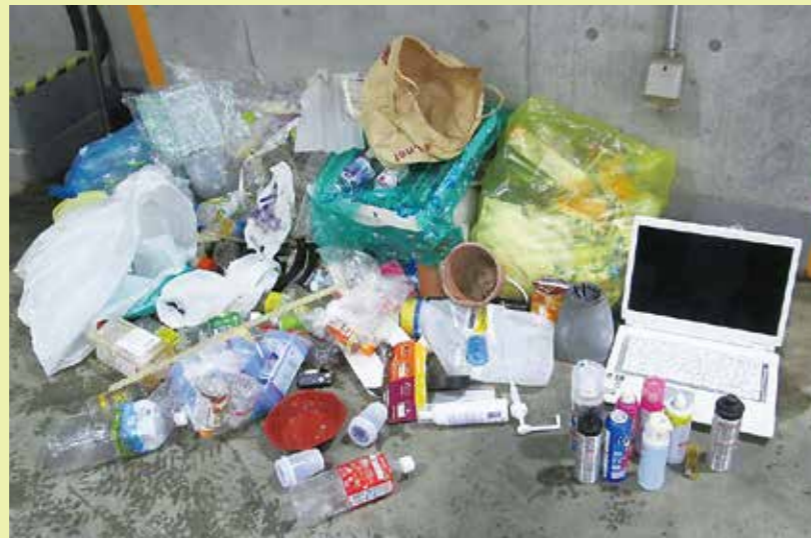
燃やせないごみから取り出した分別のできていないごみ