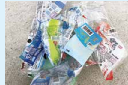
野菜、麺、パンなどの袋、カップ麺などの外フィルム、ペットボトルのラベル