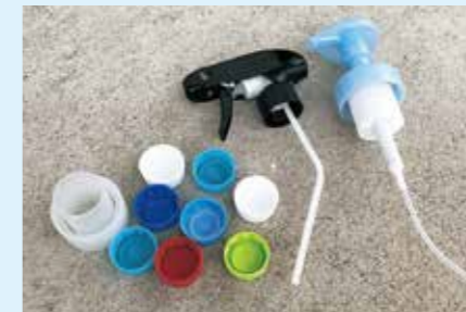
ペットボトル、シャンプーなどのプラスチック製のふた・ポンプ