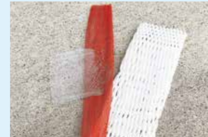
果物、野菜などを包んだネット