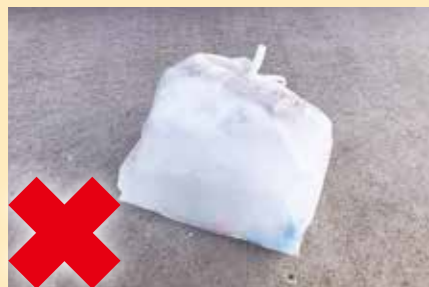
小袋に入った状態

プラスチック製容器包装は、手作業で選別を行っているため、袋に入っていると、中身の確認ができません。異物の選別・除去作業に大きな支障をきたしますので、小袋に入れず、バラバラにして出してください。ご協力をよろしくお願いいたします。