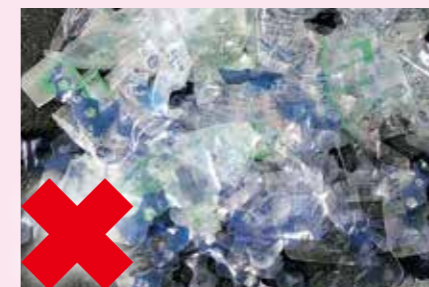
湿布薬の表面に張られた薄いフィルム