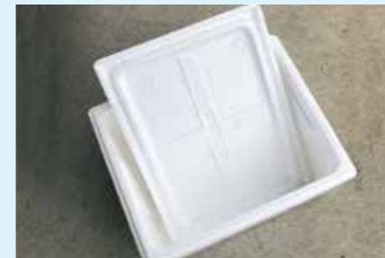
家電製品などを保護していた緩衝材、発泡スチロール(50cm角以下に切ってください。)