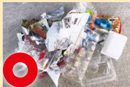
バラバラにした状態