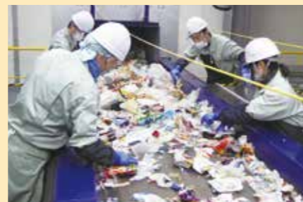
異物を取り除く手選別作業