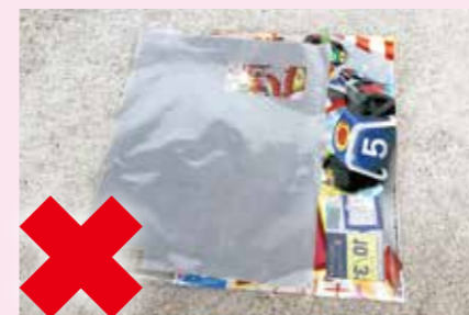
手紙やダイレクトメールを入れた袋