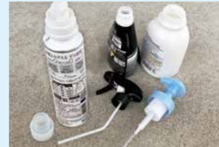
洗剤、シャンプーなどのボトル ※本体とふた(ポンプ)は分離する。