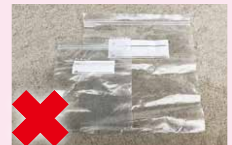
フリーザーバッグ

※「プラマーク」の表示があるが、中身(残留物)が取り除けない・取り除きにくい場合、付着汚れが落ちない場合は、 燃やせるごみ で出してください。