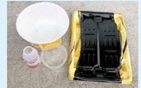
カップ麺、プリン、弁当などの容器