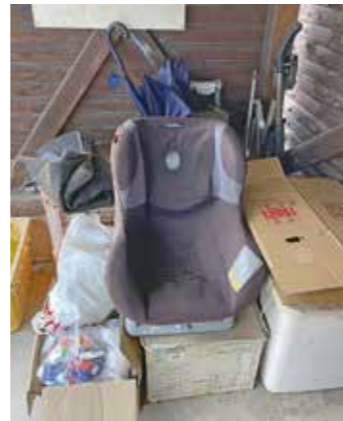
資源置場での不法投棄の様子