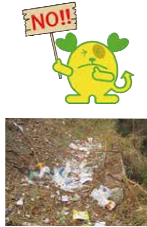
山林での不法投棄の様子