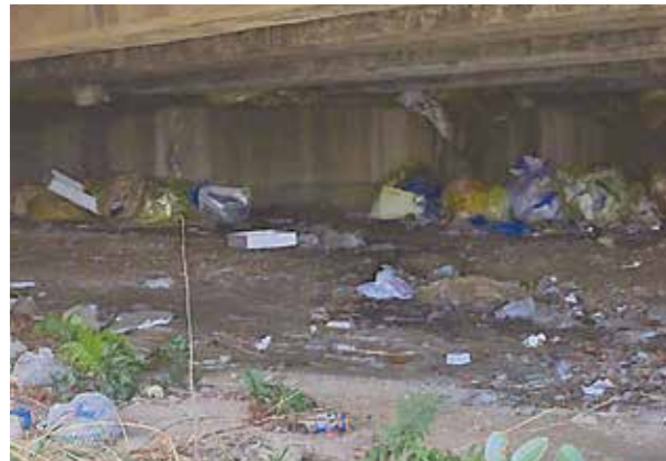
河川での不法投棄の様子