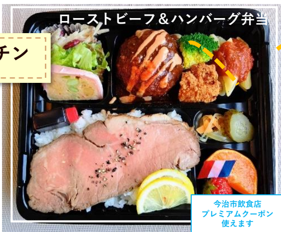
ローストビーフ&ハンバーグ弁当