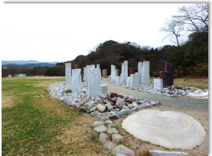
しまなみアースランド 地球の道