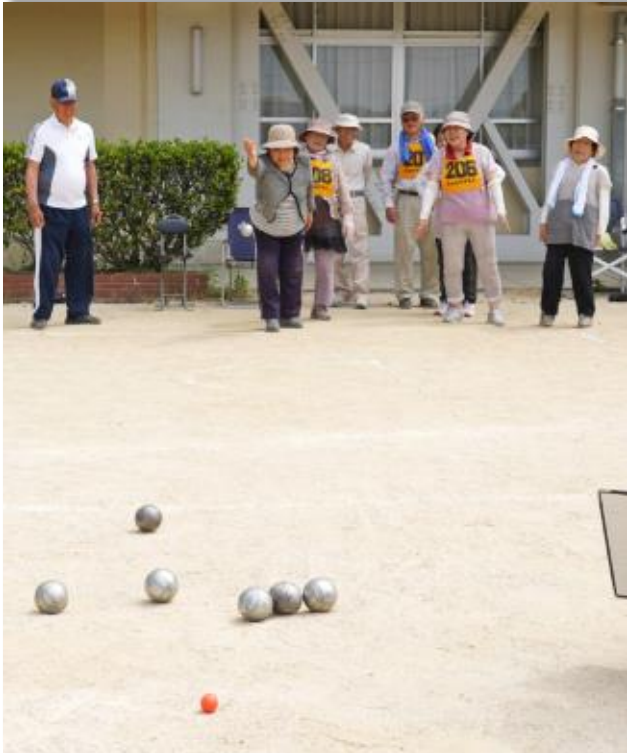
高齢者のスポーツ活動（ペタンク）