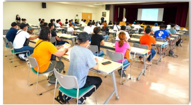
くらしの日本語教室