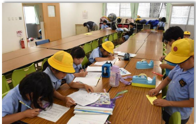
放課後児童クラブ