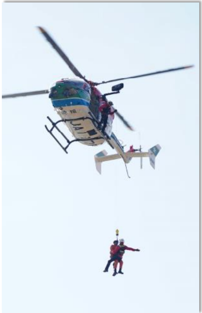
防災ヘリコプターによる救助訓練