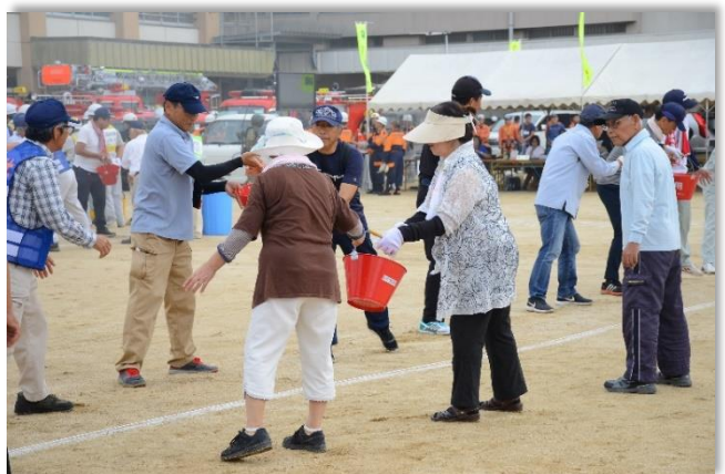
地域住民による初期消火訓練