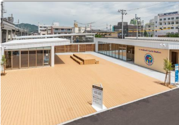
今治駅前サイクリングターミナル「i.i.imabari! Cycle Station」