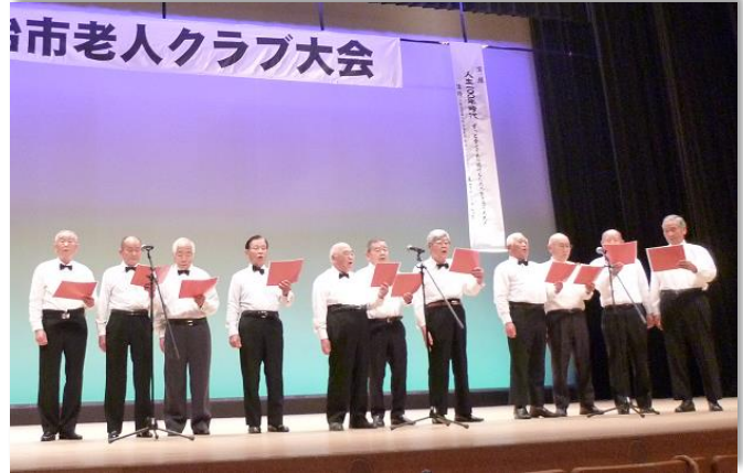
今治市老人クラブ大会