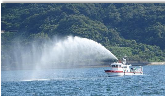
消防救急艇「しまかぜ」