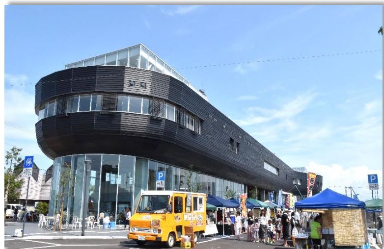
みなと交流センター「はーぱりー」