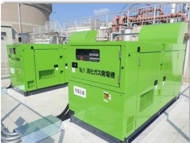
今治市下水浄化センターの消化ガス発電設備