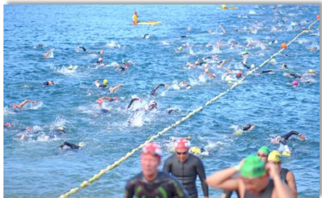
今治伯方島トライアスロン