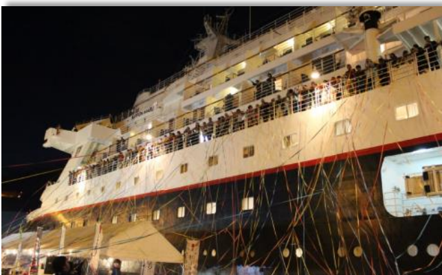
クルーズ客船「にっぽん丸」寄港