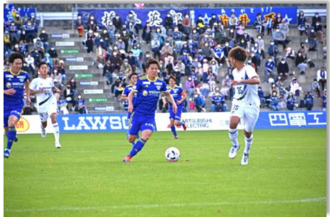
今治初のJリーグチーム「FC今治」