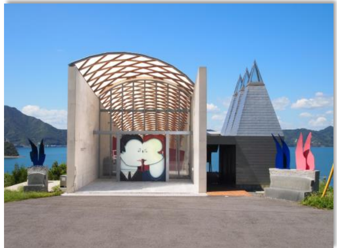
ところミュージアム大三島