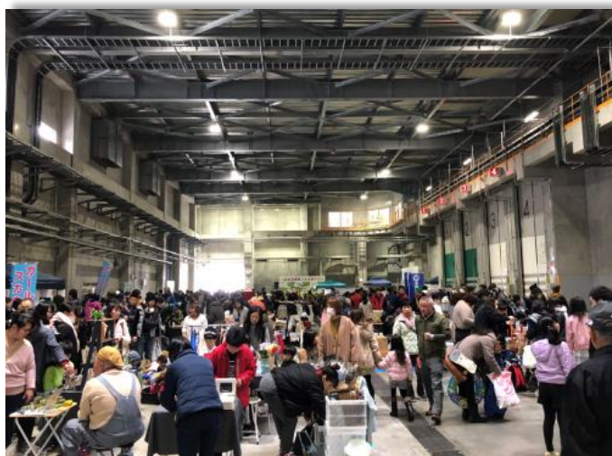
いまばり環境フェスティバル