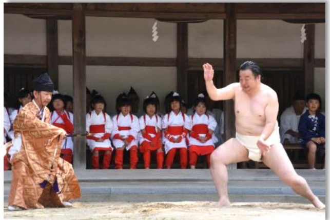
一人角力 (大山祇神社)