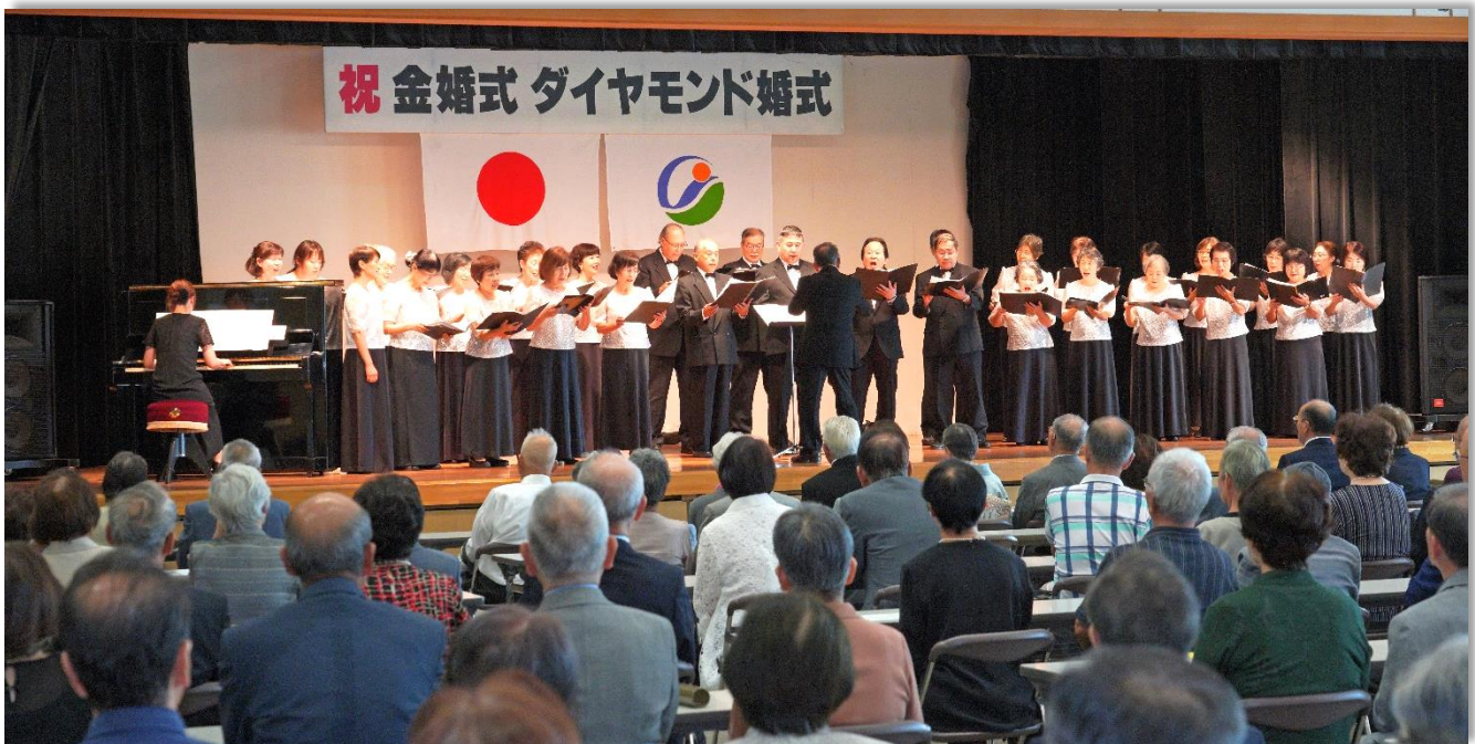
金婚式・ダイヤモンド婚式