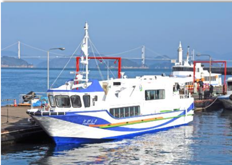
市営せきげん渡船の旅客船「とびしま」