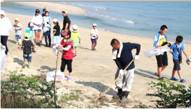
自治会による海岸清掃