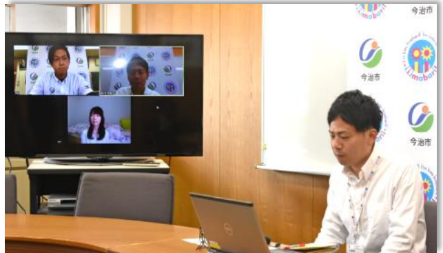
オンライン移住相談