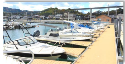
大浜地区遊漁船保管施設「マリナーパーク王浜」