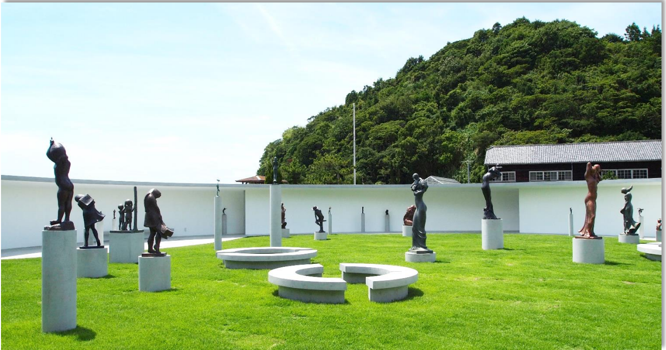
岩田健母と子のミュージアム