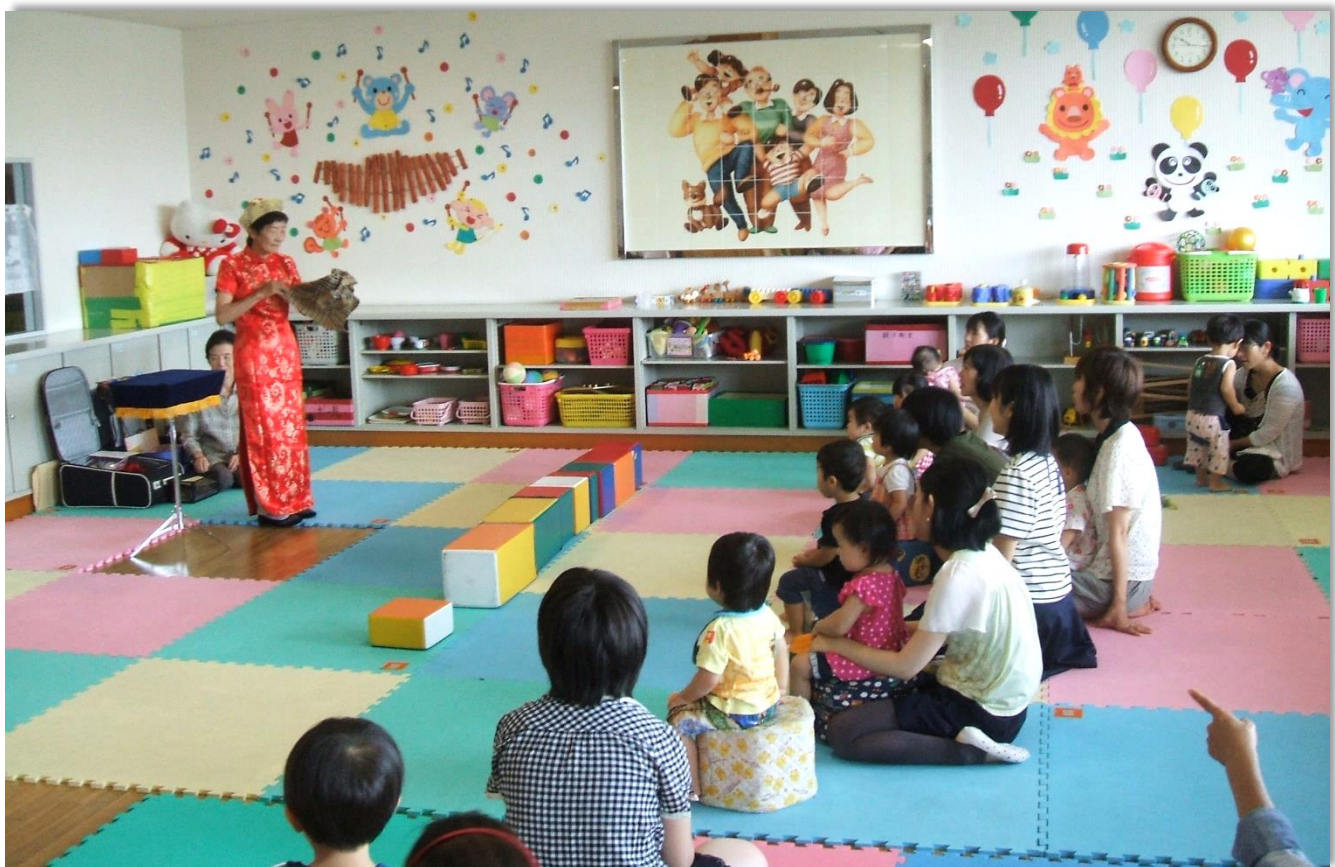
地域子育て支援拠点