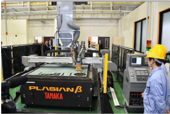
今治工業高校機械造船科