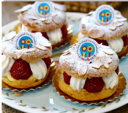
今治（パリ）プレスト