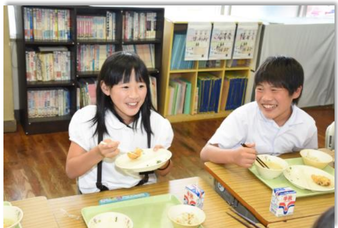
地産地消推進運動事業（学校給食）