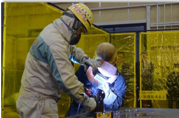
造船技能コンクール