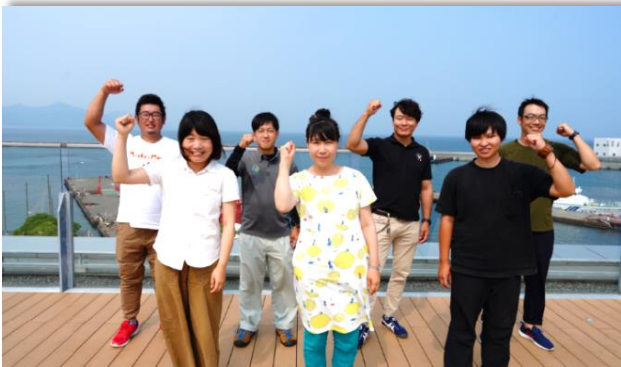
地域おこし協力隊員のみなさん