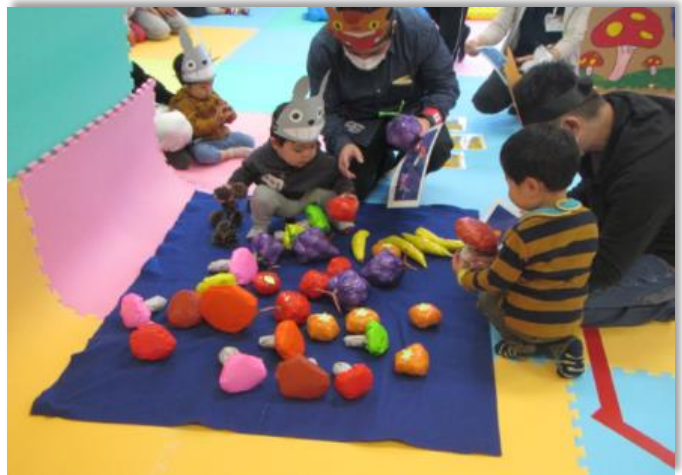
イクメン育成事業