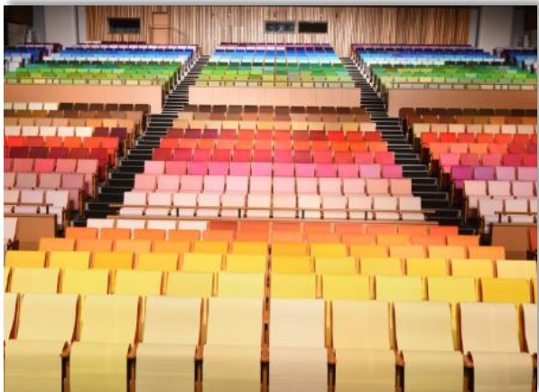
染色技術を紹介した展覧会「IMABARI Color Show」