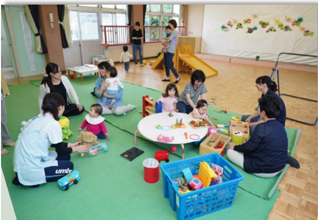
わくわく子育てサロン事業