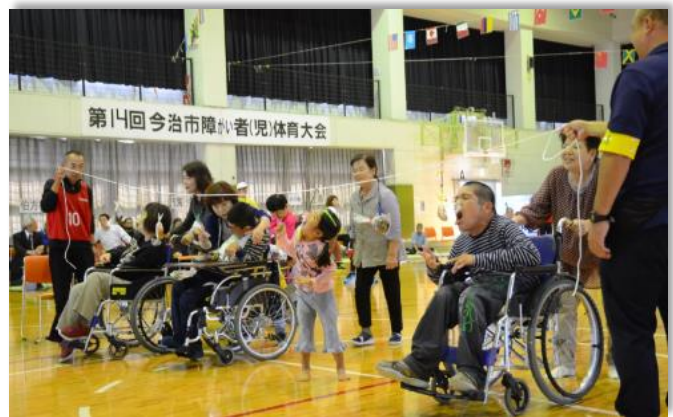
今治市障がい者(児)体育大会