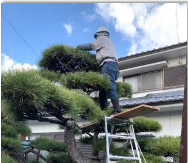
シルバー人材センター会員による剪定作業