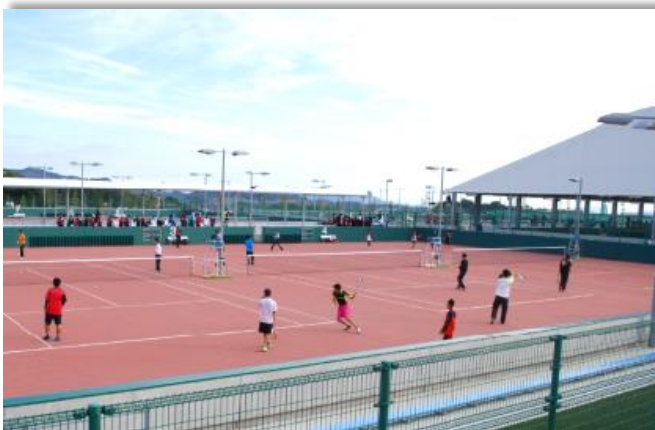
今治市営スポーツパーク