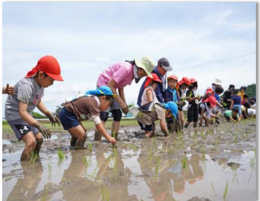
園児の田植え体験