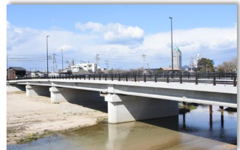
榎橋 (令和2年3月架替完了)