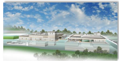
(仮称) 高橋浄水場 (令和3年度完成予定)