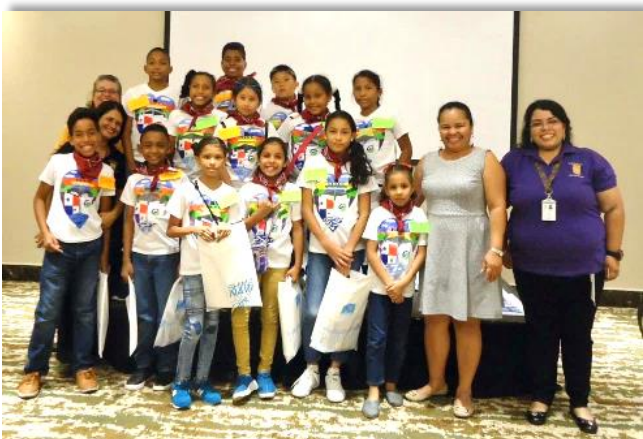
姉妹都市パナマ市の生徒たち