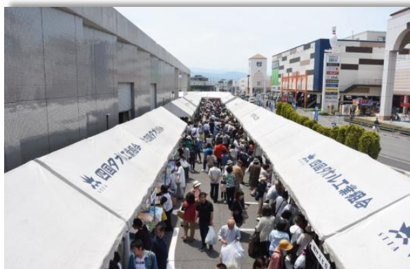
今治タオルフェア