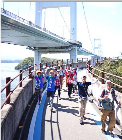
瀬戸内しまなみ海道スリーデーマーチ