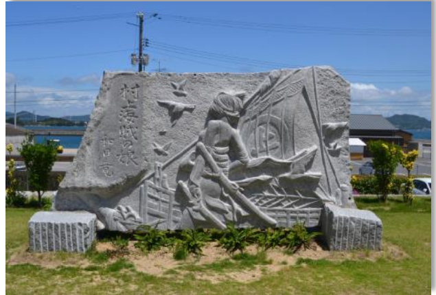
大島石を使ったレリーフ