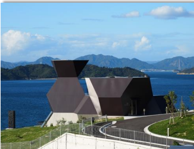
伊東豊雄建築ミュージアム