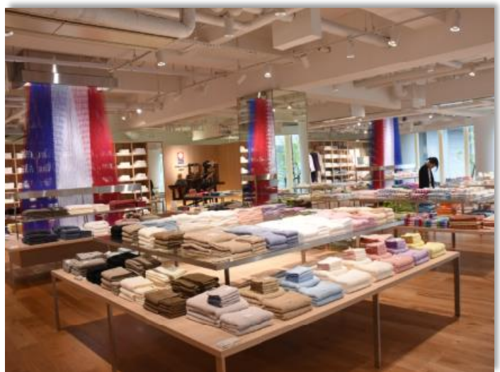
今治タオルショップ本店