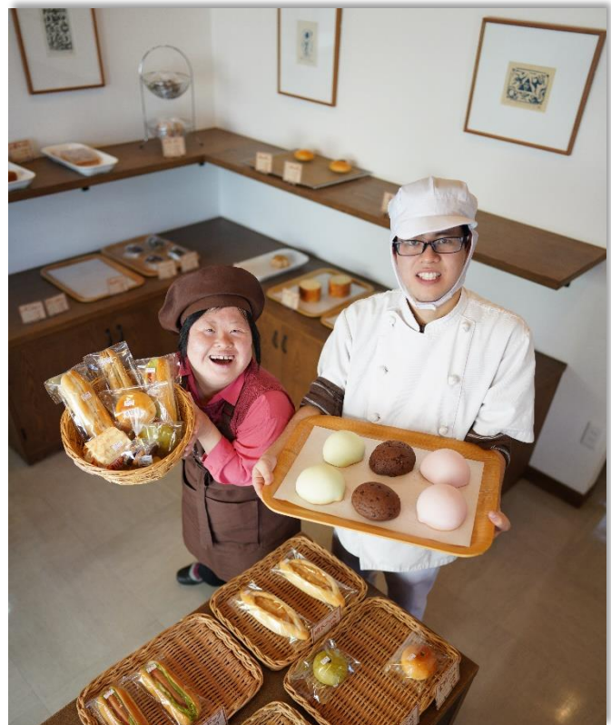
就労支援事業所での活動風景