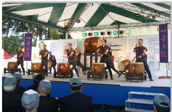
姉妹都市の太田市で寿太鼓を披露