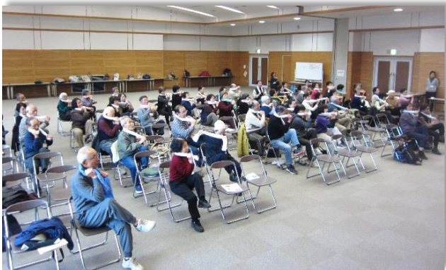
今治ことぶき大学