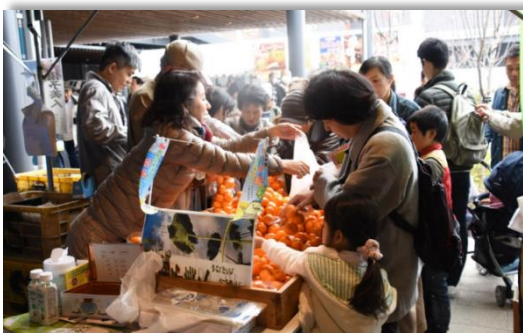
岡山理科大学今治キャンパス学生祭「ゆめいこい祭」