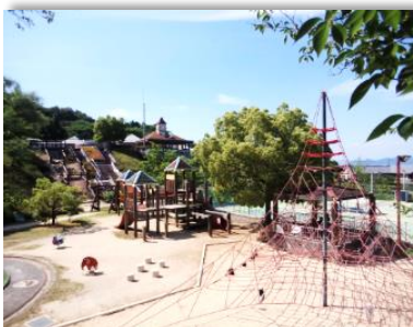
朝倉緑のふるさと公園