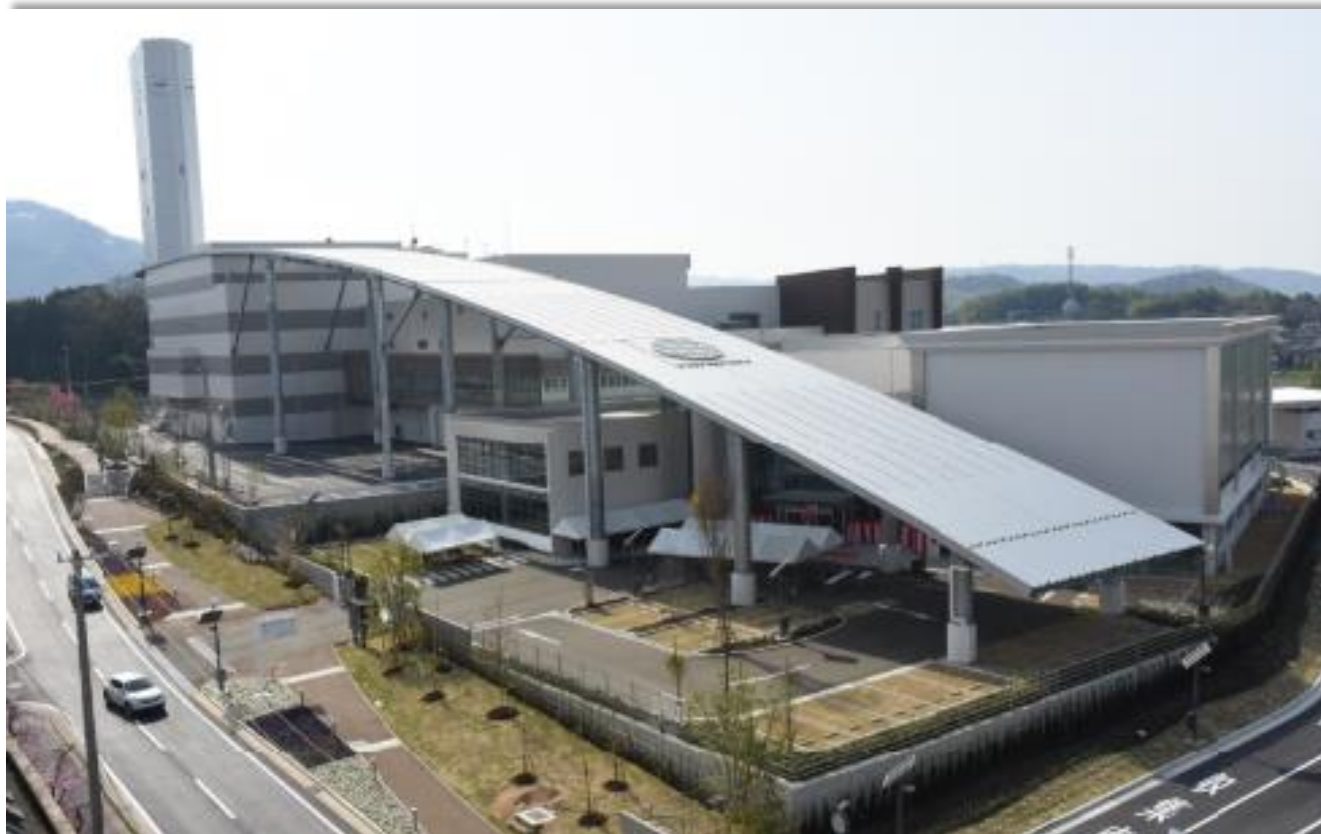
今治市クリーンセンター「パリクリーン」ジャパンレジリエンスアワード 2019 グランプリ受賞