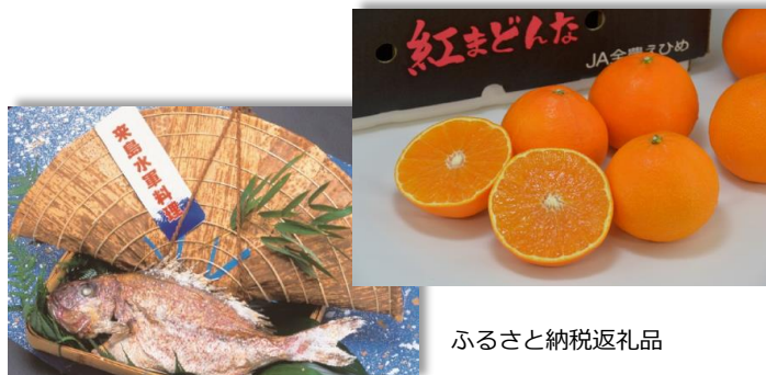
ふるさと納税返礼品