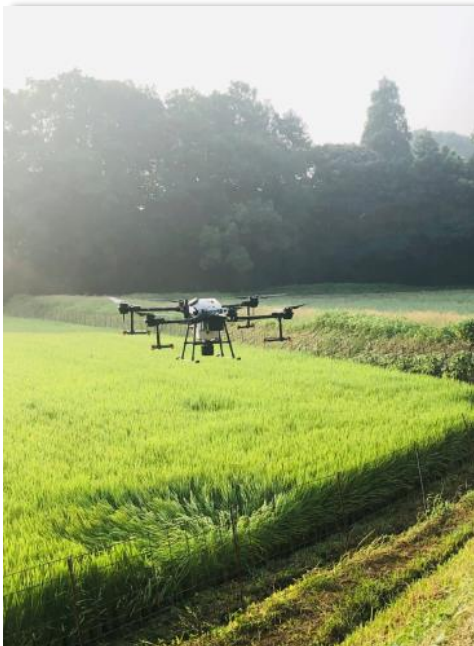
ドローンによる農薬散布