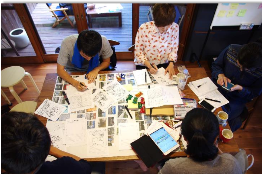
大三島でワーケーション