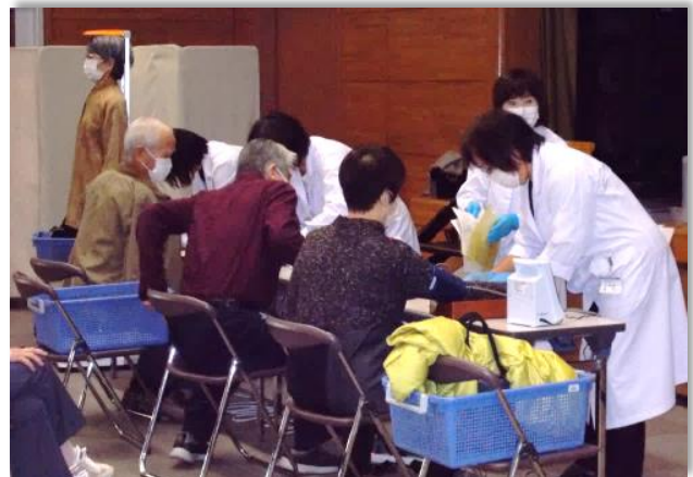
特定健診・がん検診