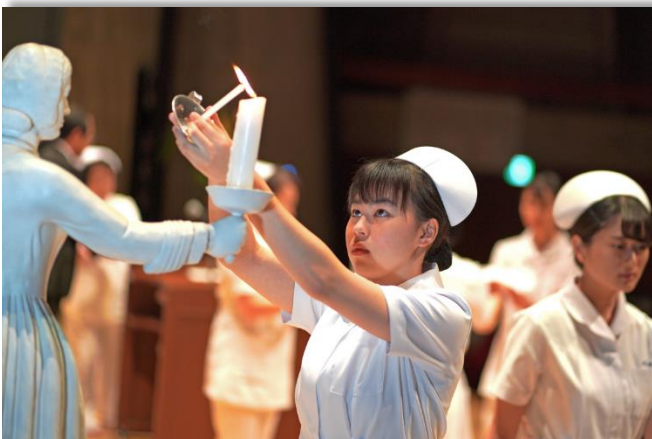
今治看護専門学校戴帽式