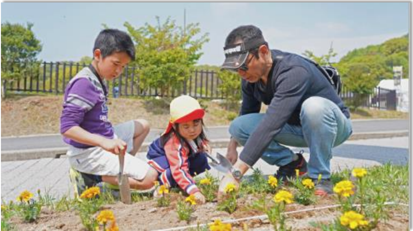
いまばり緑化フェア 花苗植イベント