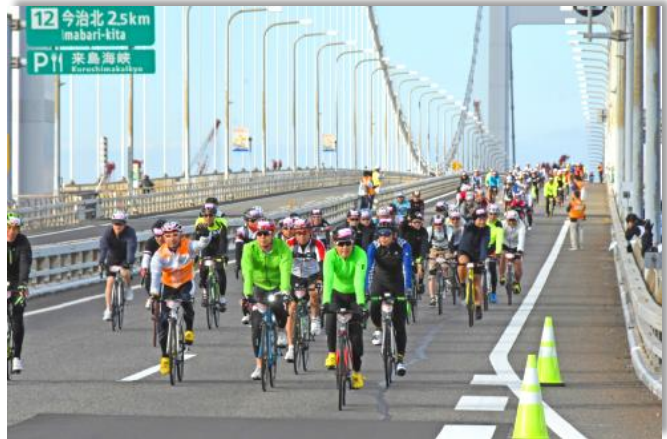
瀬戸内しまなみ海道・国際サイクリング大会