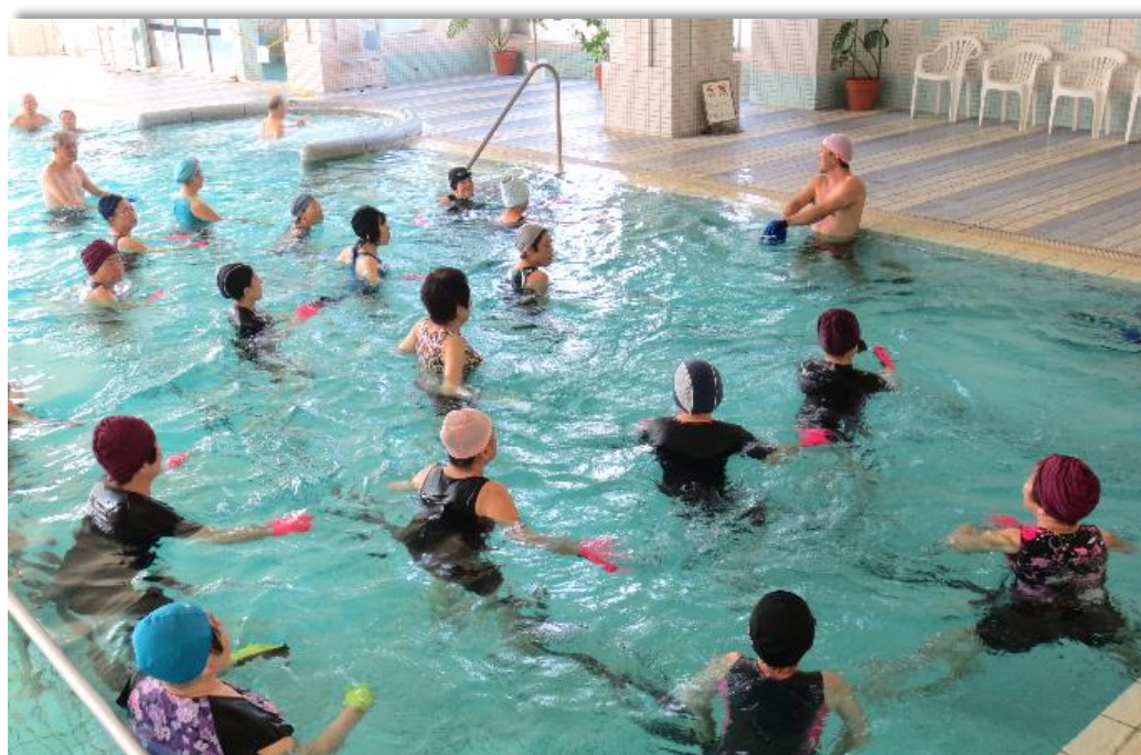
クアハウス今治 健康づくり教室