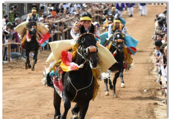
お供馬の走り込み (加茂神社)