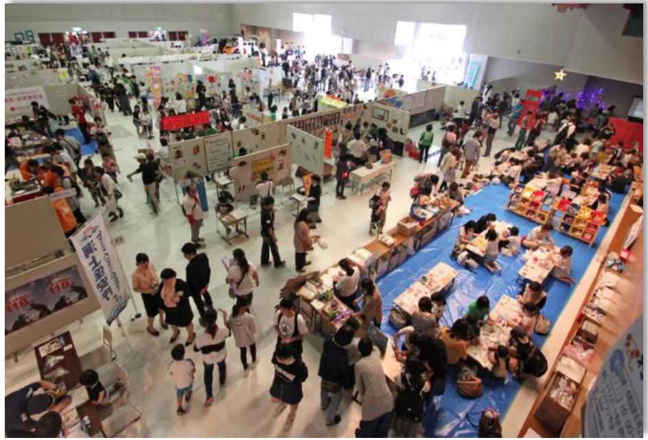
じどうかんバリっこフェスタ&スマイルママフェスタ