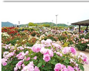
よしうみバラ公園