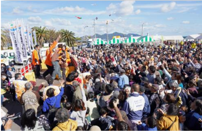
農業まつり・漁協まつり