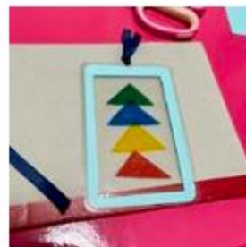
身近なもので遊んじゃおう！