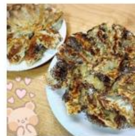
つくってみてね！ カンタンレシピ