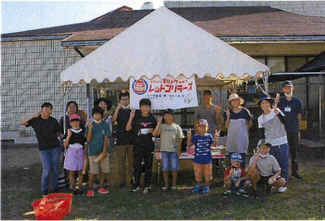
9月25日 福祉関係者やモルックを買ってみたものという家族さんなどが参加した講習会