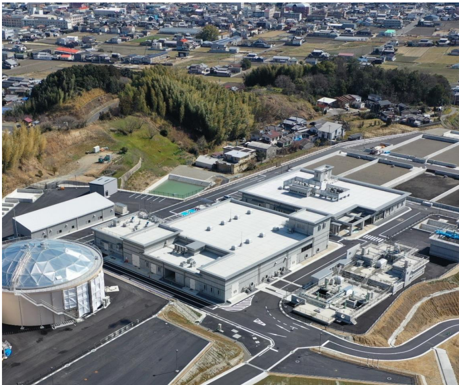
高橋浄水場 (バリウォーター)