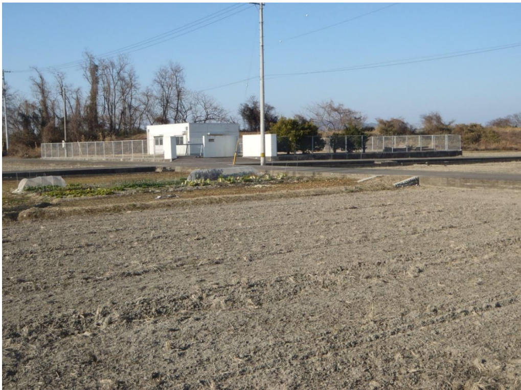
(今治市玉川八幡浄水場)