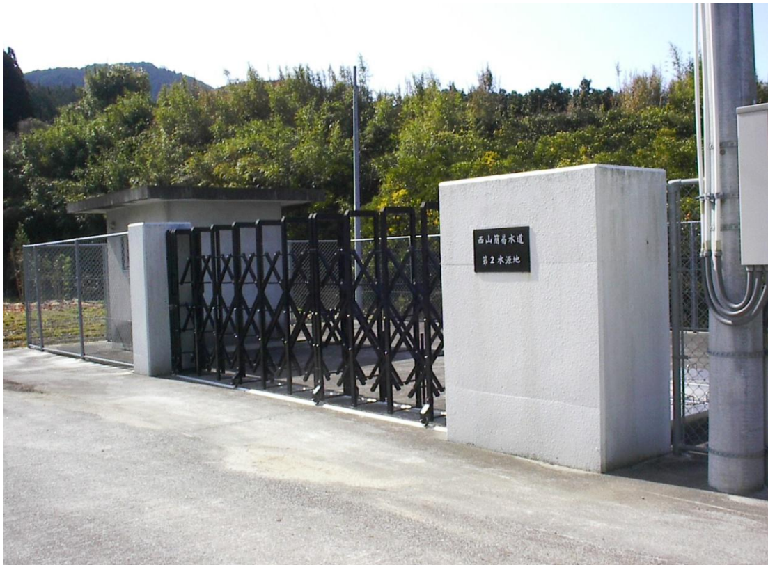
(今治市菊間西山第2水源地)