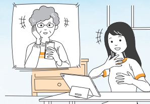
●家族や友人との会話