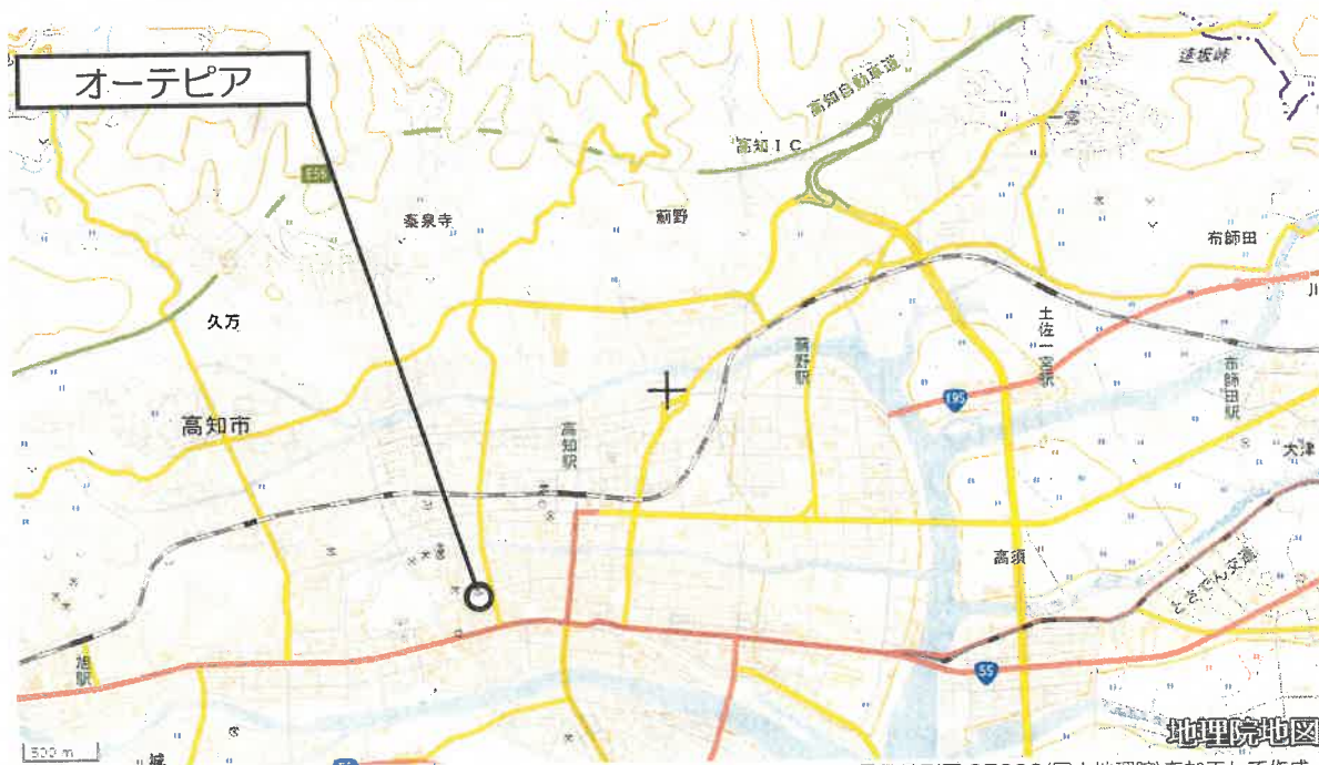
電子地形図 25000(国土地理院)を加工して作成