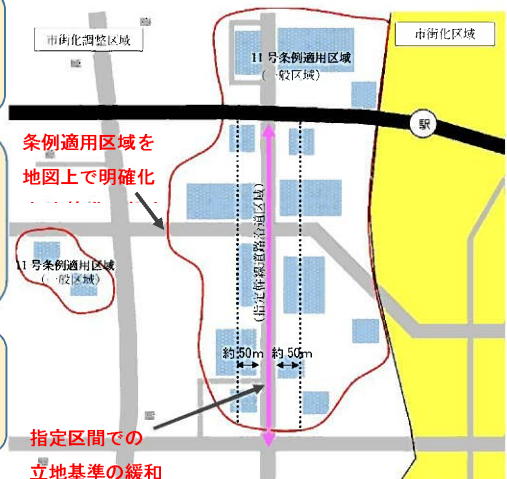
【立地基準の見直しイメージ図】

11号条例の適用により建築された住宅の「 属人性 」を解除し、既存住宅の有効活用を図ります。